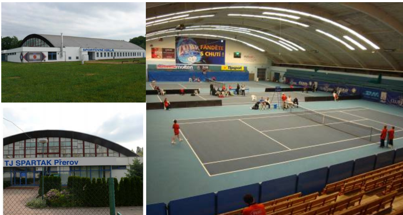
(3 hřiště povrch Courtsol Comfort)